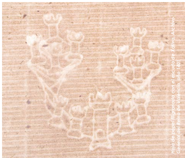
Hoja de papel filigranada con el escudo de Xàtiva. Archivo General del Reino de Valencia, año 1401

En octubre de 2009, el Institut Valencià de Conservació i Restauració de Béns Culturals de la Generalitat Valenciana, y el Instituto del Patrimonio Cultural de España del Ministerio de Cultura, la Diputación Provincial de Valencia y el Ayuntamiento de Xàtiva organizaron, en esta ciudad, unas jornadas de estudio sobre El papel hispanoárabe para poner de manifiesto la importancia que tuvo el papel como soporte escritorio en el Mediterráneo durante la Edad Media y el protagonismo de la localidad de Xàtiva, por ser la primera población de Occidente de la que se sabe documentalmente que tuvo industria papelera.